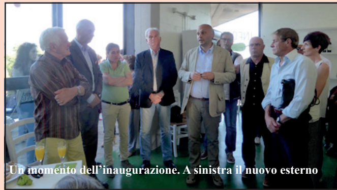
Un momento dell'inaugurazione. A sinistra il nuovo esterno