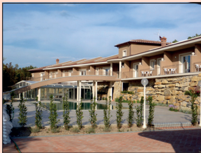
La nuova ala del resort I Piastroni. Sotto la piscina con acqua calda termale, in parte coperta.

Il Centro-benessere è dotato di 26 lussuose suite, di cui 8 con piscina riservata al pernottamento e caminetto, tre Spa per 2-4 persone, un percorso con bagno turco, sauna, docce emozionali (la stanza del sale,