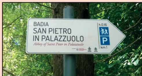
La nuova segnaletica e un gruppo di partecipanti alla visita guidata del Primo Maggio

Grazie all'Unione montana dell'Alta Val di Cecina attorno all'Abbazia di San Pietro è stata fatta la pulizia essenziale auspicata da tempo. Sono stati creati anche due “coni visuali” puntati sull'abitato di Monteverdi e sulla Val di Cornia. Peccato che il timore di effetti negativi di venti forti sui vetusti muri abbia costretto a limitare il taglio degli alberi, ne soffre la vista dal basso, ma meglio così piuttosto che rischiare nuovi crolli. Anche l'unione (con la “u” minuscola) ha lavorato in senso positivo, sono state messe insieme risorse del Comune e un contributo di Badivecchia - che ha rinunciato ad un progetto sostenuto